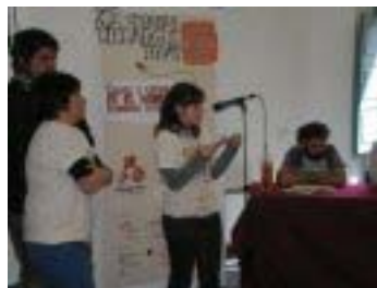
Triangle Jove a Sant Feliu de Guíxols